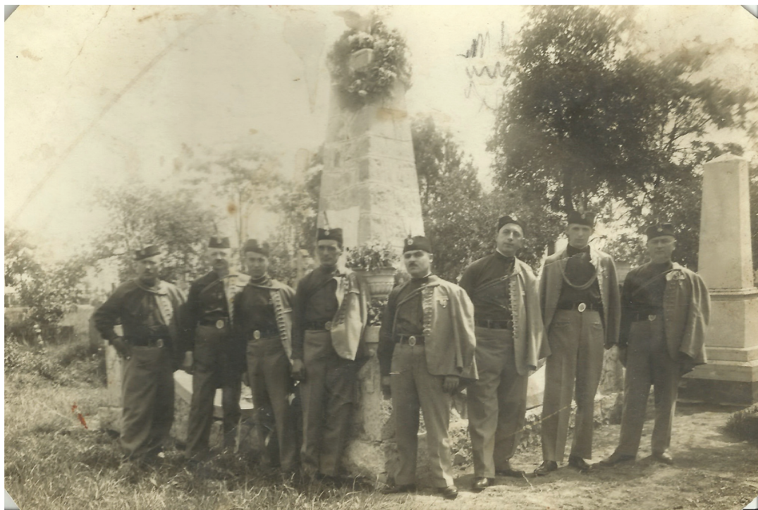
Управа старопазовачког „Соколског друштва“ испред споменика добровољцима, јунацима Великог рата, касне двадесете године прошлог века

Улога Словака у развоју старопазовачког соколства: јединство под словенским стегом