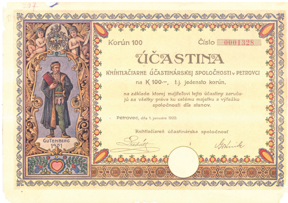
Акција штампарије, Бачки Петровац, 1920.

Прилог о чехословачко-југословенским економским односима 20-их година 20. века