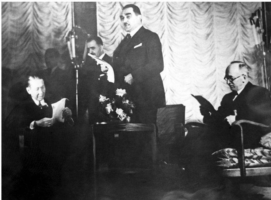
Министар спољних послова Румуније Николаје Титулеску, премијер и министар спољних послова Југославије Милан Стојадиновић и министар спољних послова Чехословачке Едвард Бенеш на Конференцији Мале атанте на Бледу, Југославија, 30. август 1935. године

ко-југословенско савезништво су обе стране сматрале веома блиским. Њихови представници су чак изговарали наратив о братским народима, што је потврђено слоганом Věrnost za věrnost, ljubav za ljubav . [4] Већ од првих послератних година постојала је претпоставка за развој ових односа и у другим сферама јавног