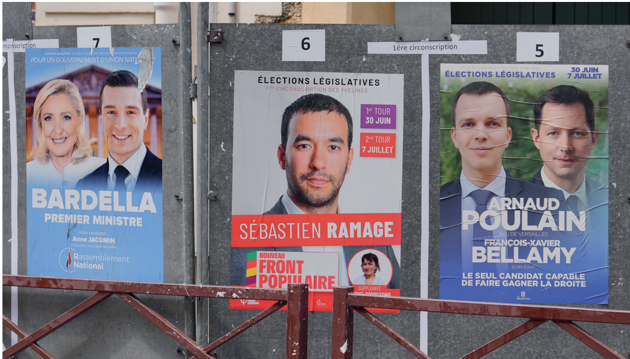
Плакати са кандидатима за парламентарне изборе, Версај, Француска – 26. јун 2024.

Контекст и последице ванредних парламентарних избора у Француској 2024. године: Успон актера са десног и левог спектра политичког деловања