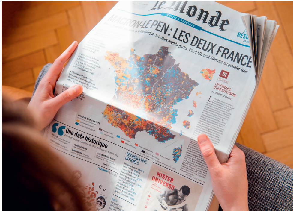
Мапа са резултатима избора у француским новинама Le Monde, Париз, 24. април 2017.

Контекст и последице ванредних парламентарних избора у Француској 2024. године: Успон актера са десног и левог спектра политичког деловања