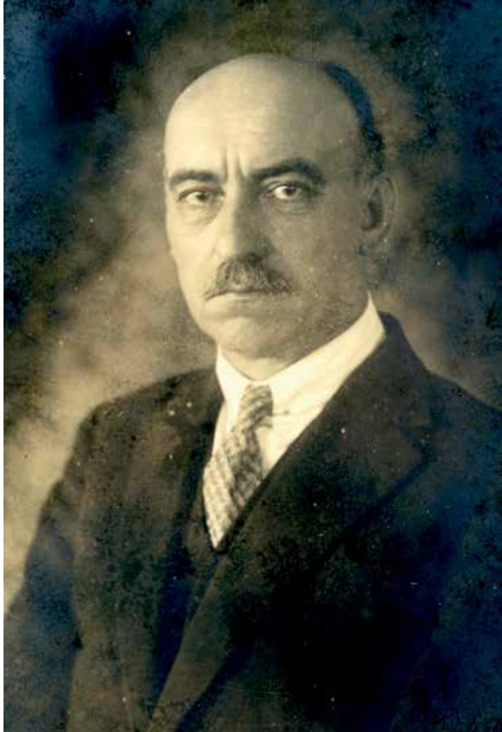
Војислав Маринковић