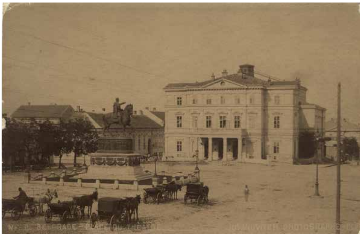
Позоришни трг. Народно позориште у Београду, фотографија Милана Јовановића око 1900. У овом здању су одржавана скупштинска заседања; при крају своје владавине, 1888, краљ Милан, прогласио је Радикалски устав, који је сматран за један од најнапреднијих устава у тадашњој Европи.