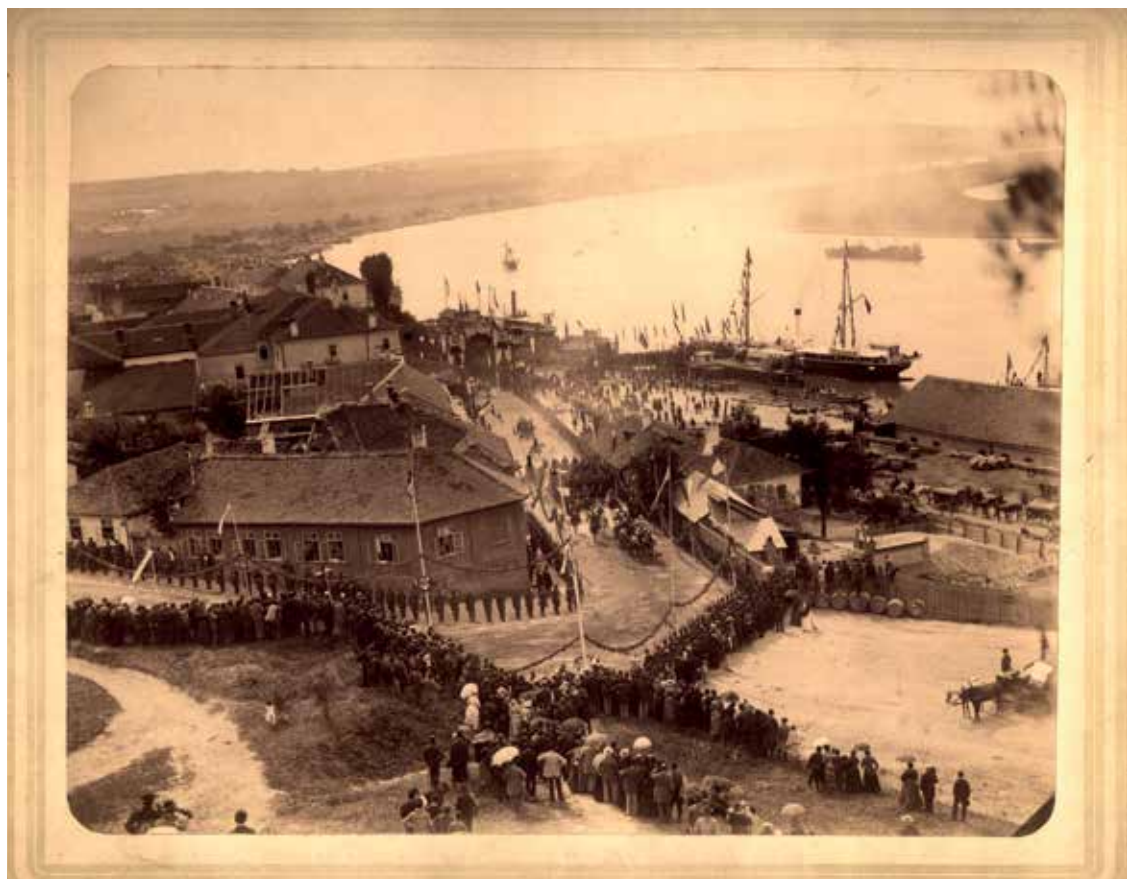
Поглед са Калемегдана према Париској улици и Савском пристаништу. Дочек краља Милана приликом повратка са бојишта.

политичких разговора. Године 1901. изабран је за председника Сената. У завереничкој влади Јована Авакумовића обављао је дужност министра иностраних послова. Био је редовни члан Српског научног друштва 1870. и почасни члан Српске краљевске академије 1893. Умро је у Београду 1907. године.