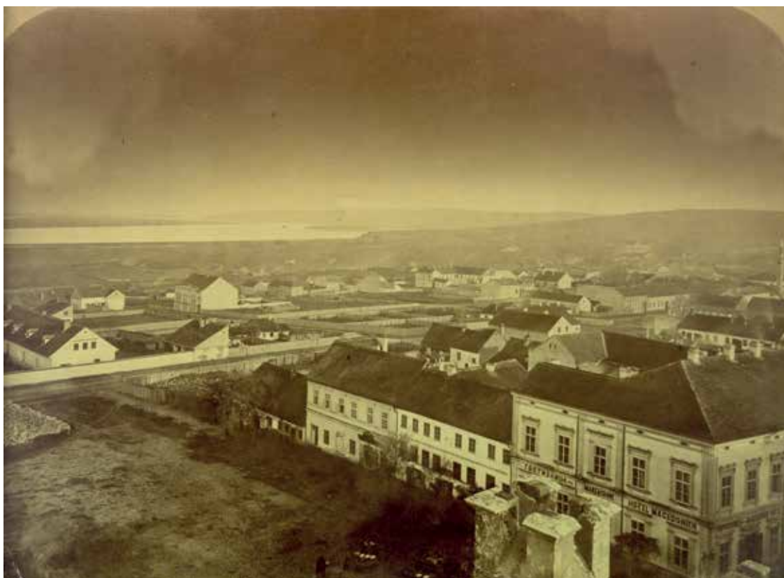
Поглед на Дорхол и Дунав са Капетан Мишиног здања, 1876-1878.

Правда 1904. и председник Српског новинарског удружења 1906. године. Писао је запажене позоришне текстове и критике, а радио је и на законском регулисању рада Народне библиотеке. Оснивач је Етнографског музеја, Женске учитељске школе, Богословије Светог Саве и Уметничког одељења Министарства просвете. Сарађивао је са Слободаном Јовановићем, Јанком Веселиновићем, Браниславом Нушићем, Миланом Гролом, Станиславом Винавером. Умро је у Врњачкој Бањи 1925. године.