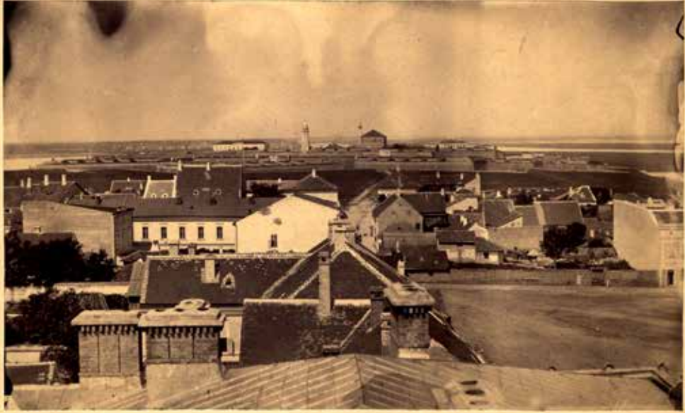
Поглед на Калемегдан са Капетан Мишиног здања, фотографија Анастаса Јовановића, око 1865. (МГБ)