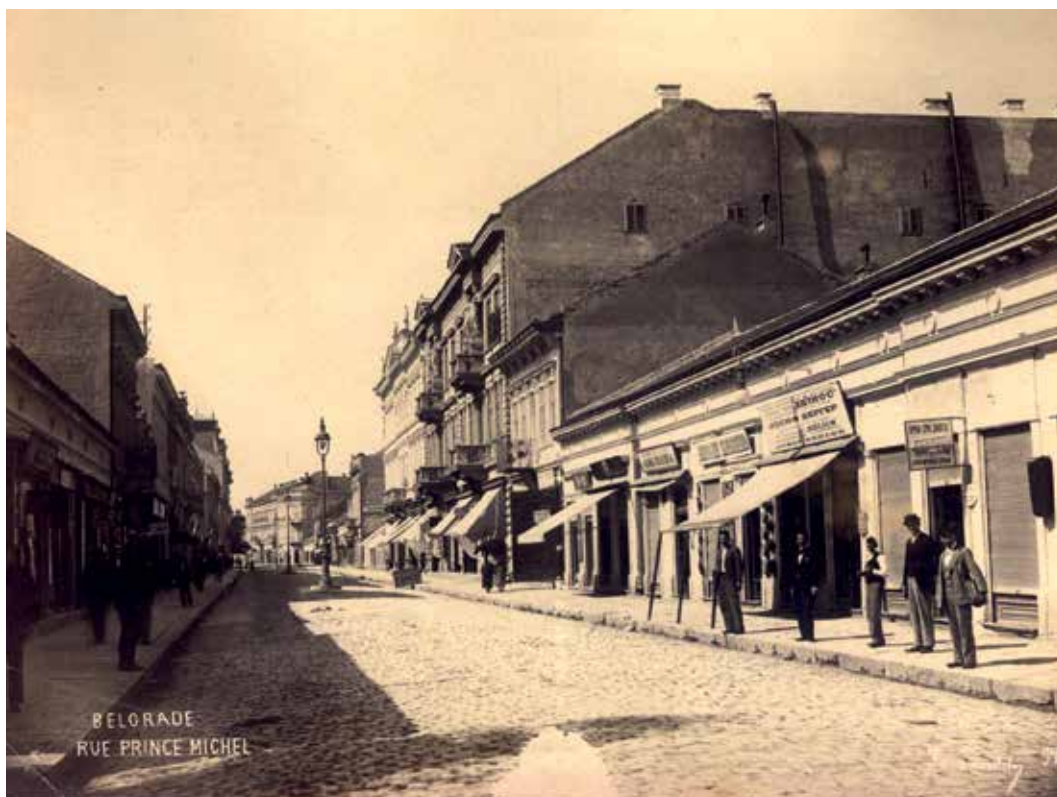
Улица кнеза Михаила, око 1900.