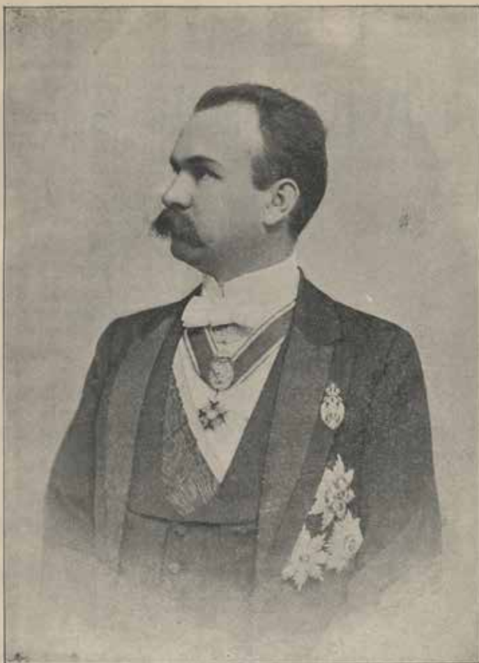
Министар Просвете и Црквених послова