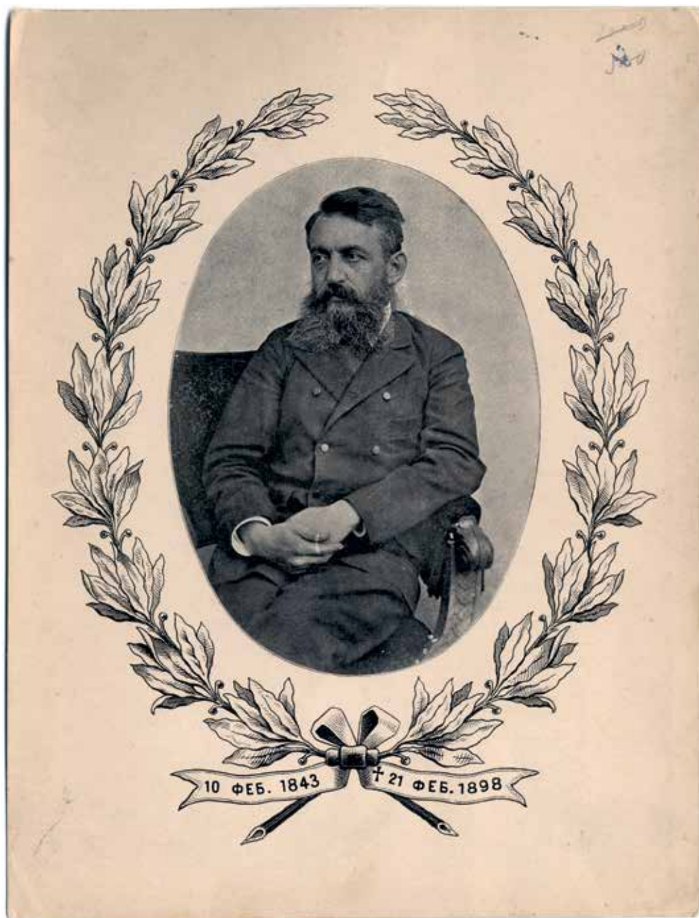
Милутин И. Гарашанин. Портрет у грађанском оделу. (Фонд фотографија БГБ, инв. бр. 992, сиг. Ф-П-238)