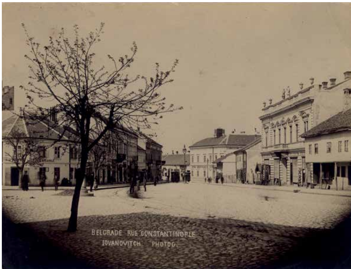
Теразије, угао Кнеза Михаила и Македонске, око 1900.