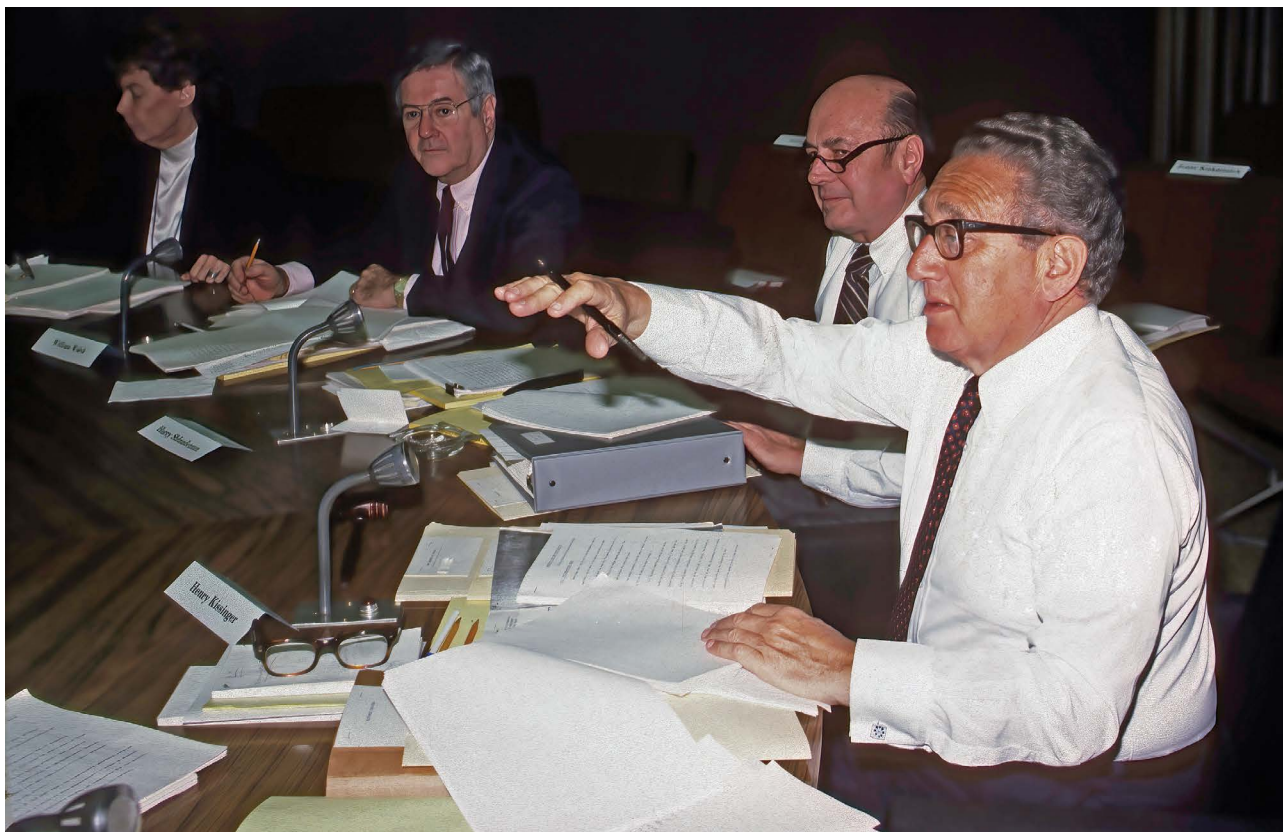
Бивши државни секретар Хенри Кисинџер, председавајући Двопартијске комисије за Средњу Америку председника Регана, на састанку у Стејт департменту, Вашингтон, 6. јануар 1983. године

да се Русија и Запад – посебно Русија и Европа – уведу у међународни систем сарадње“ (Kissinger, 2014). Нажалост, Кисинџерова упозорења, дата на време, нису узета у обзир. Догодило се оно што је предвидео и данас имамо рат између НАТО (САД + ЕУ) и Русије на подручју Украјине