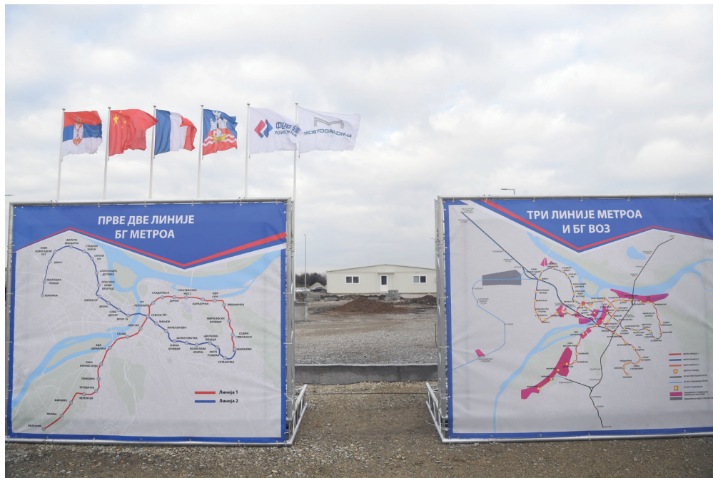
贝尔格莱德地铁马基仕车辆段建设的准备工作,这是塞尔维亚最大的基础设施项目之一

习近平总书记指出:“应对共同挑战、迈向美好未来,既需要经济科技力量,也需要文化文明力量。”中华文明以整体性、共生性思维看待和理解不同地域、不同语言的社会与人群,主张民胞物