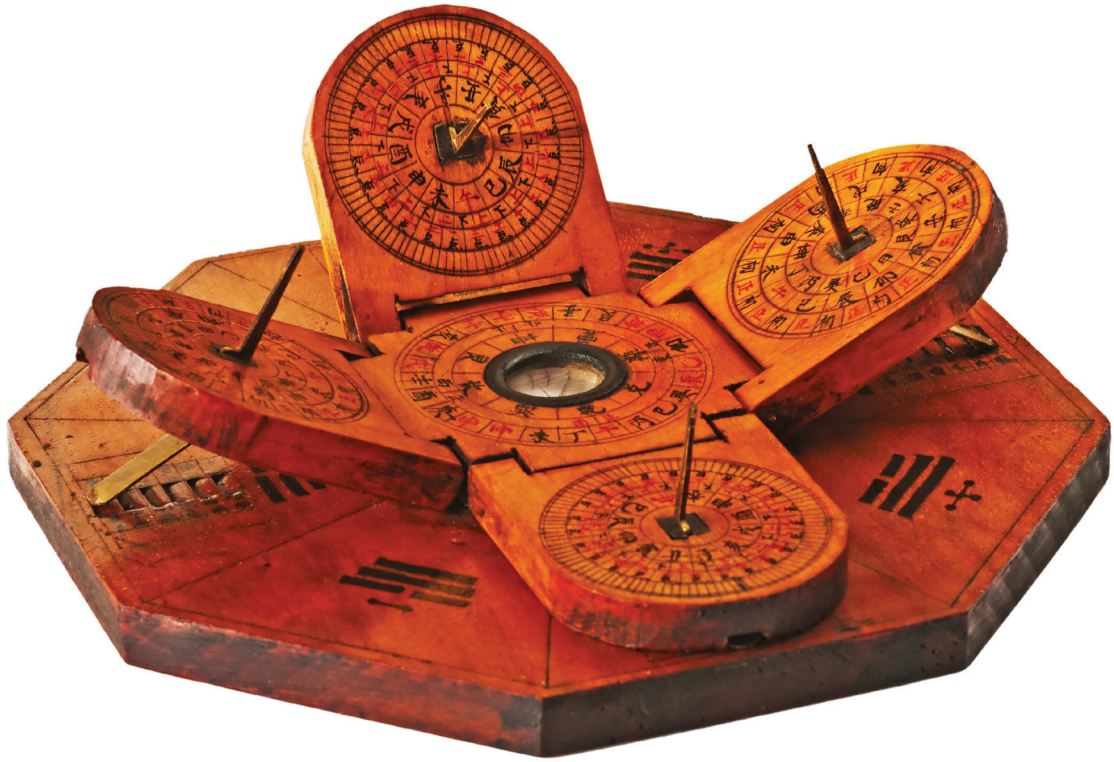
中国古代带指南针的日晷仪