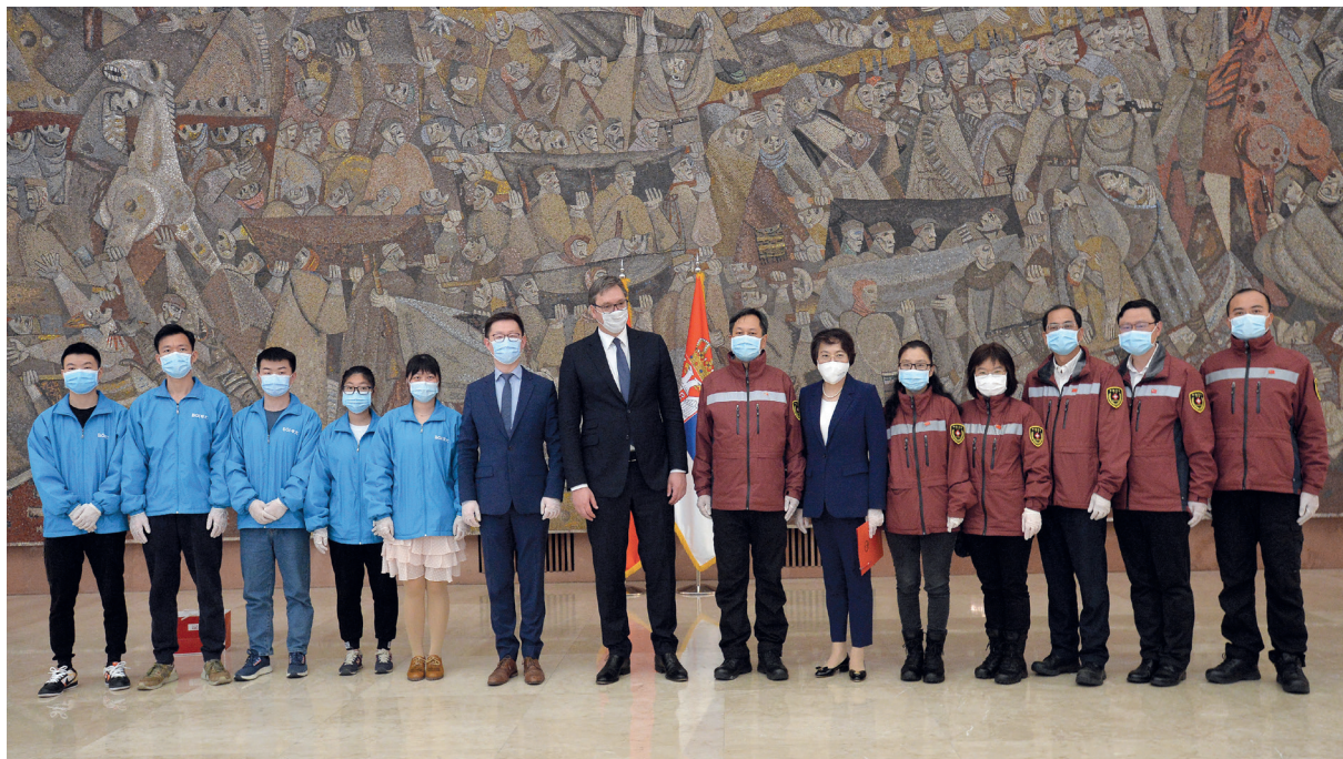
Председник Републике Србије Александар Вучић и амбасадорка НР Кине у Србији Чен Бо са тимом кинеских медицинских специјалиста за борбу против COVID-19, Београд, 1. мај 2020. године