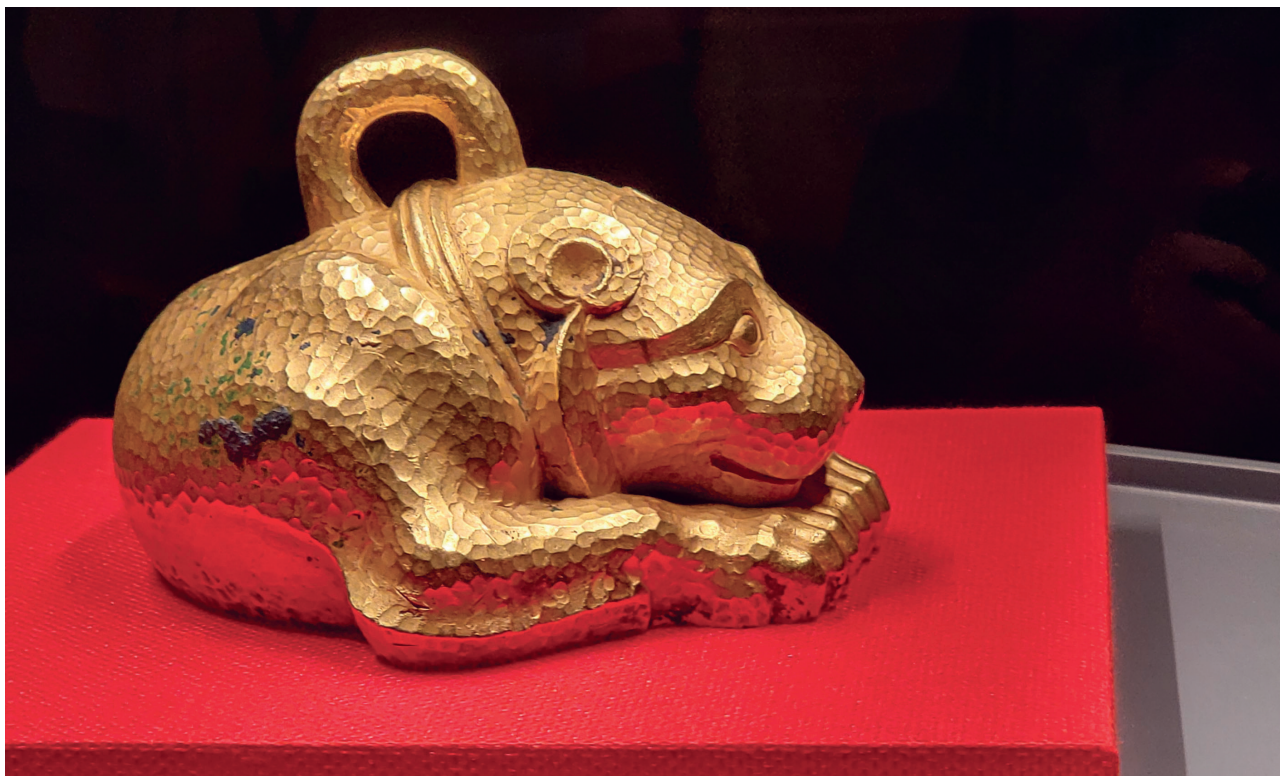
Један од изузетно вредних експоната са изложбе у музеју Нанђинг