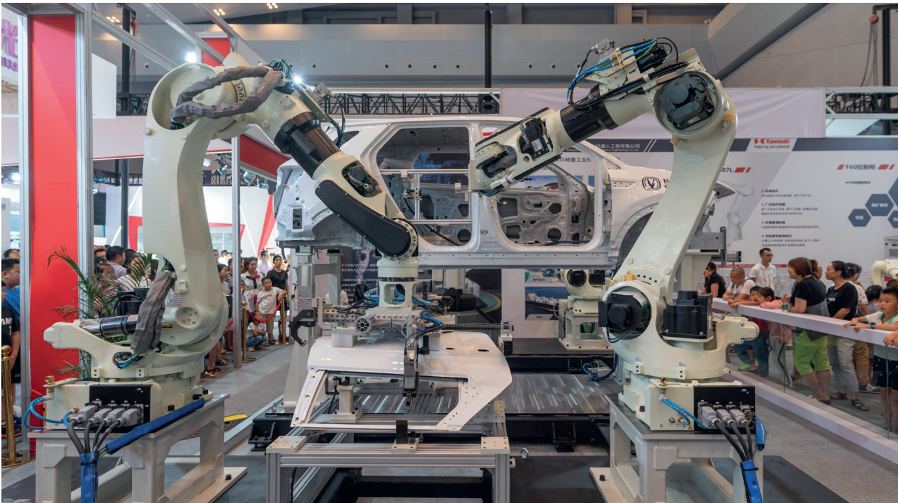
Роботизоване руке које се користе у производњи аутомобила