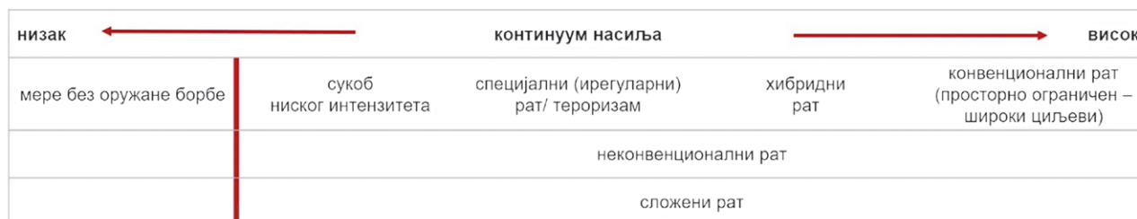
Графикон 1. Хофманов континуитет насиља прилагођен класификацији ратова у овом раду